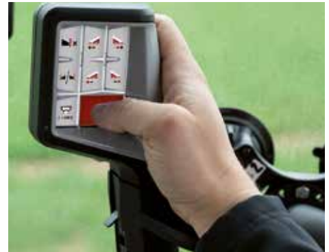
ISOBUS Joystick für CCI 800 / CCI 1200

GPS Empfänger AG-Star zzgl. MwSt.: 1.500,-- € ISOBUS-Traktoreinbaukabel zzgl. MwSt.: 543,-- €